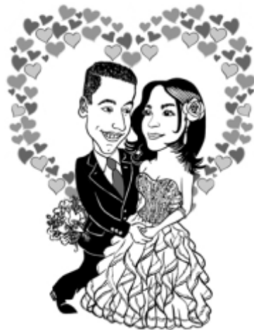
Preto e Branco sem cenário R$ 120,00