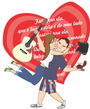
Arte de Catálogo R$ 50,00