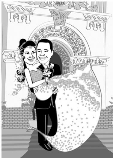
Preto e Branco com cenário R$ 135,00

Adicional animais de estimação = R$20,00 cada