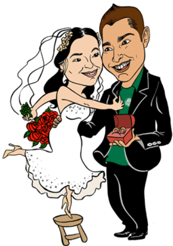
Arte de Catálogo R$ 50,00

Solicite-nos o catálogo ou acesse nossa galeria: www.flickr.com/photos/casandonopapel/sets